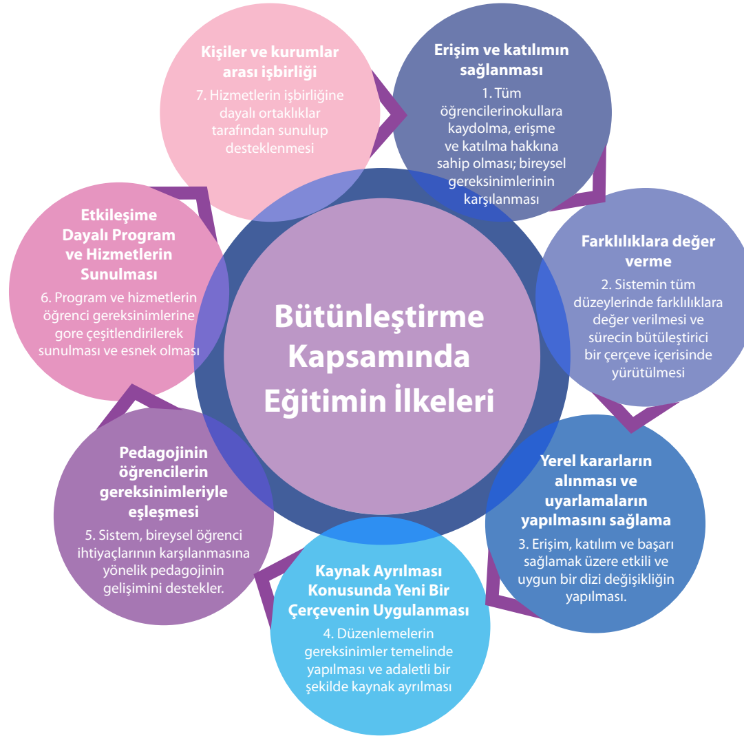
Şekil 2: Bütünleştirme kapsamında eğitim ilkeleri