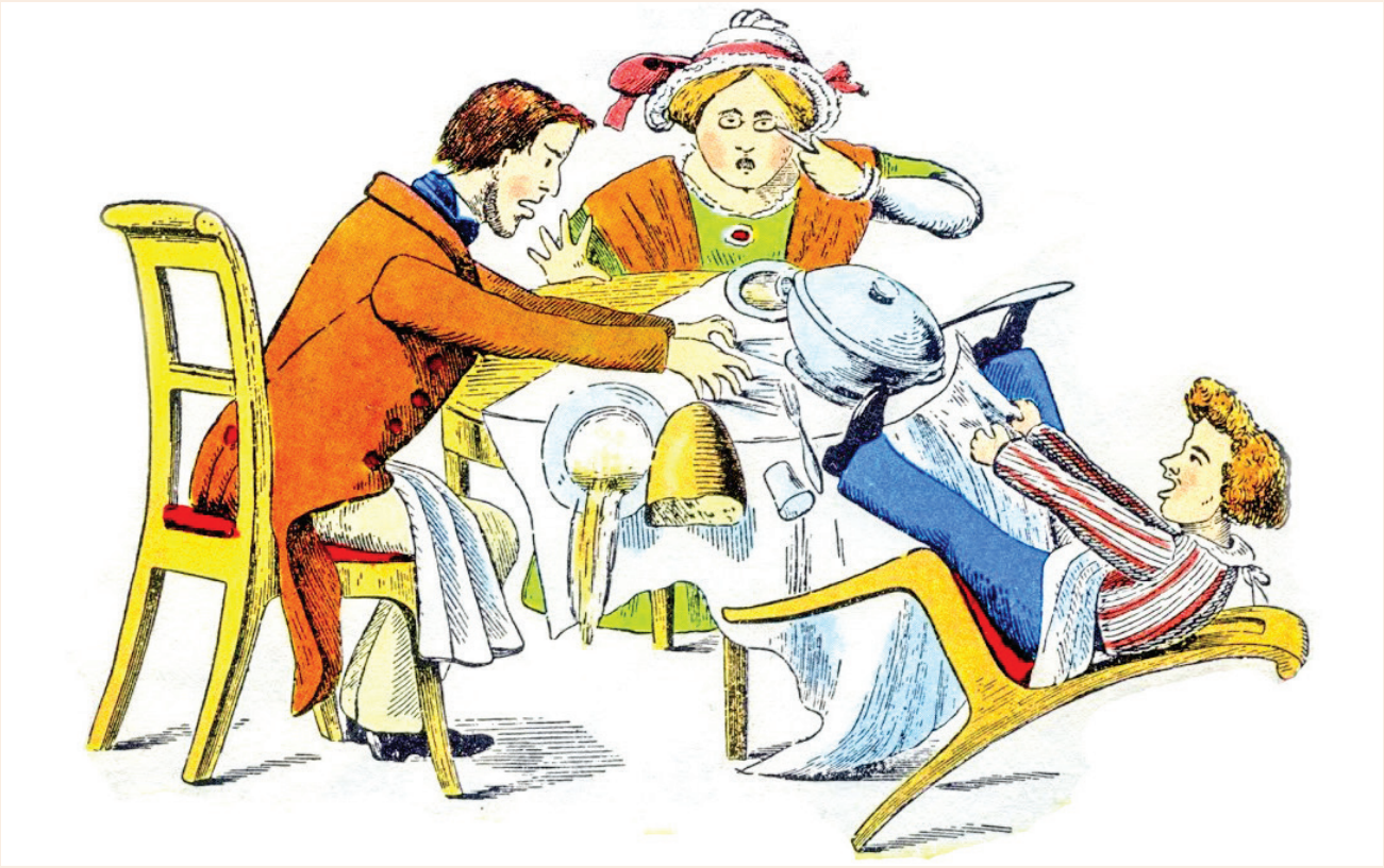
Resim 1: Fidgety Phil”, Heinrich Hoffmann. [2].

Sanılanın aksine DEHB, bir modern çağ hastalığı değildir. Heinrich Hoffmann, 1844 yılında, “Kıvrır Kıvrır Phill” diye tanımladığı, kahramanı DEHB olan bir hikâye kitabı yayımlamıştır [2]. DEHB, bilimsel anlamda ilk kez 100 yıl önce tanımlanmıştır. 1902’de Lancet’de, George Frederic Still isimli bir çocuk hekimi tarafından bazı çocukların daha hareketli olduğunu, zihinsel yetersizlikleri olmadığı hâlde akademik olarak zorlandıklarını ve ahlak kurallarını öğrenmekte güçlük çektiklerini bildirmiştir [3]. Bu üç belirti, günümüzde DEHB tanısı için gerekli kriterleri tanımlamaktadır. Daha sonraki yıllarda, bilimsel sınıflama sistemlerinde farklı isimlerle anılan bu bozukluk, 1987’de “Dikkat Eksikliği Hiperaktivite Bozukluğu” olarak isimlendirilmiştir. DEHB, hakkında en fazla araştırma yapılan ve tanısallığı en yüksek olan bozukluklardan biridir.